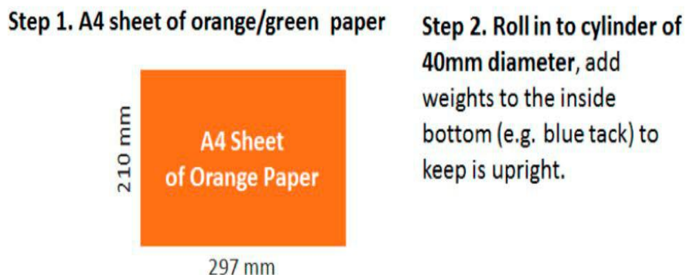
图 2: 建议的圆柱体结构