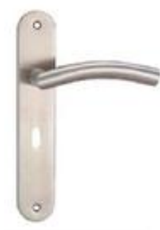
图 2 门把手