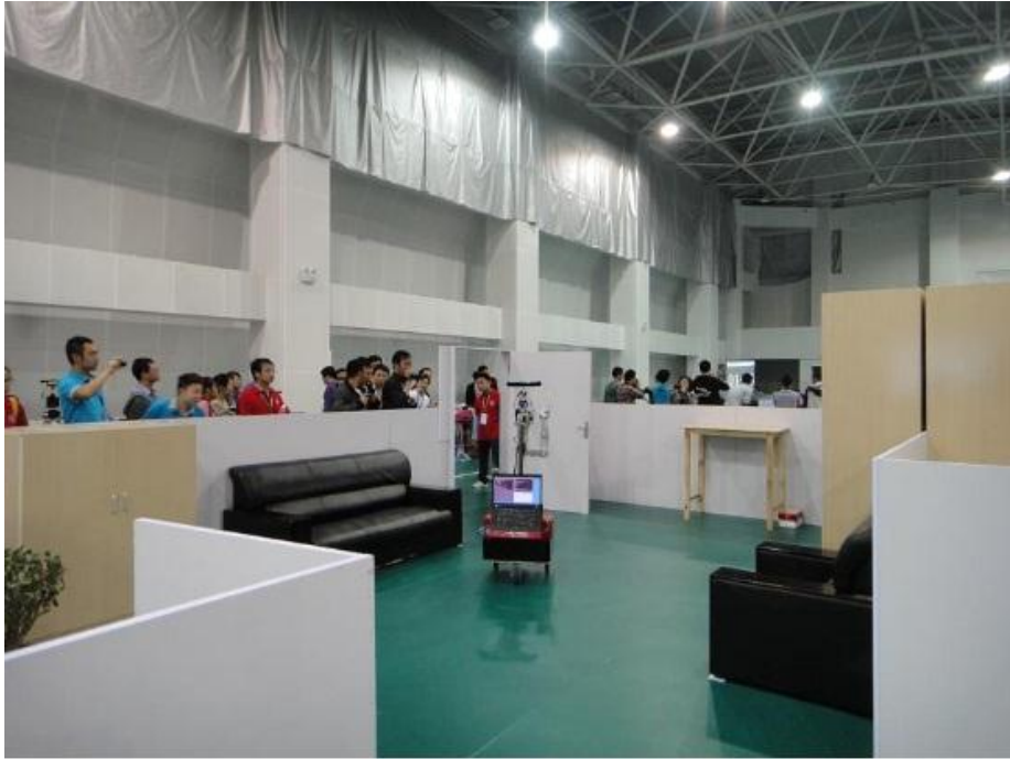
图 1 大赛实拍图