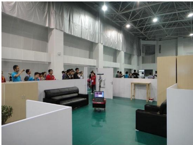
图 1 大赛实拍图