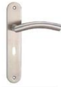
图 2 门把手