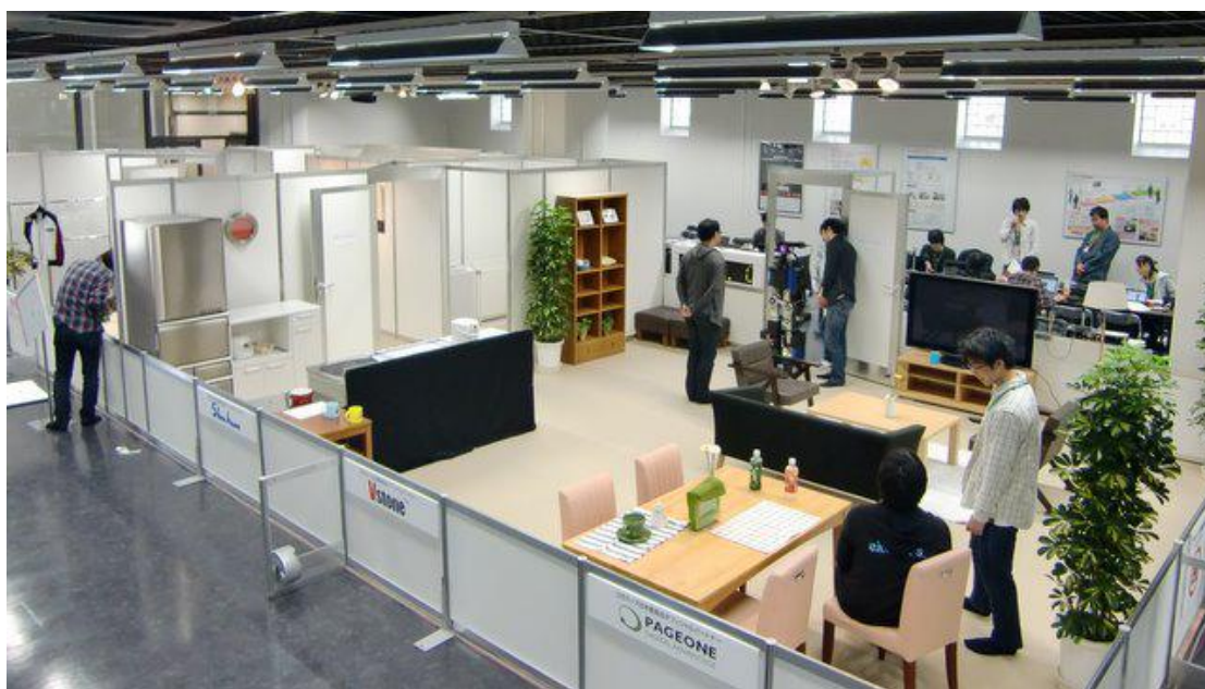
图 3.1(a) 典型比赛环境