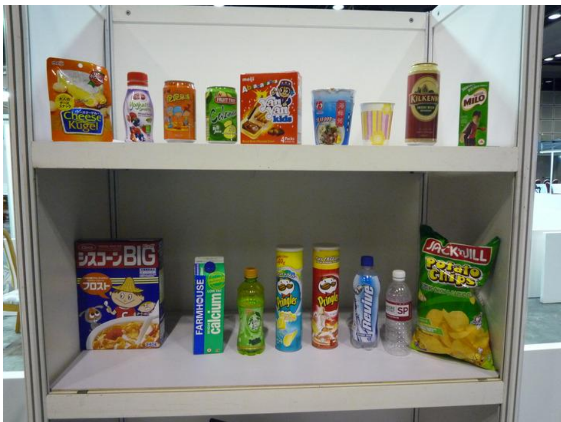
图 3.1(b) 典型的物品