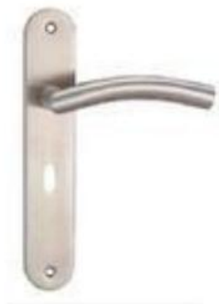
图 3 门把手