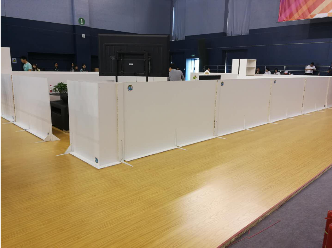
图 2 四周各加装 2 米