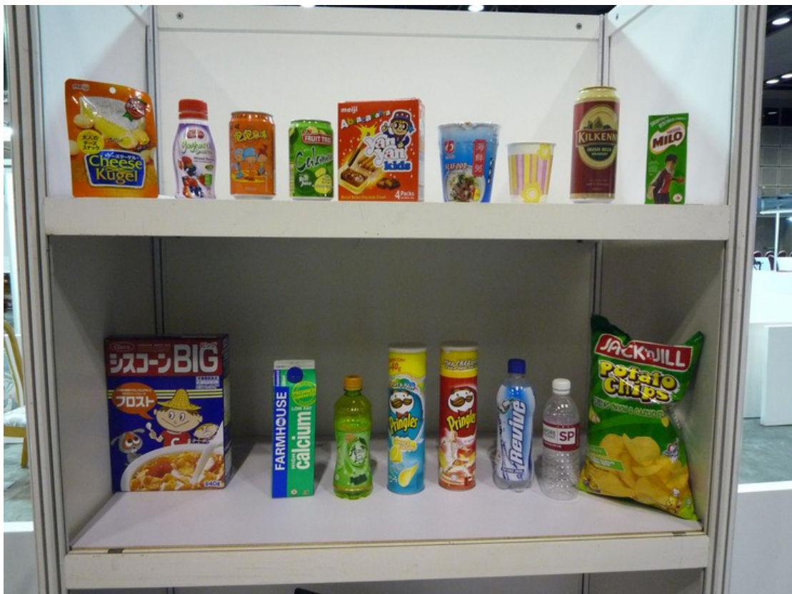
图 3.1(b) 典型的物品