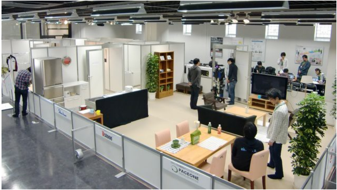
图 3.1(a) 典型比赛环境