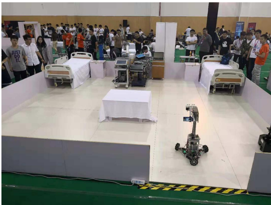
图 3 比赛场景图