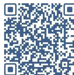
开票请扫描二维码

2. 转账缴费（上传缴费凭证）的参赛队，可扫描右侧二维码进行开票申请。（申请时请上传符合要求的支付凭证，否则会造成无法开票的结果）