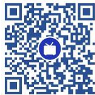
中国机器人大赛官方 B 站视 频号