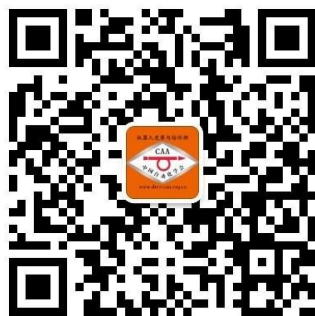
中国自动化学会 机器人竞赛与培训部 官方微信号