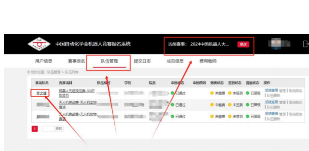
报名成员排列顺序查询 1

8. 晋级至“国赛”参赛队伍报名者，在晋级成功后，务必再次确认所有参赛人员的排列顺序。相关信息会在参赛证件、获奖证书等重要比赛文件中体现；