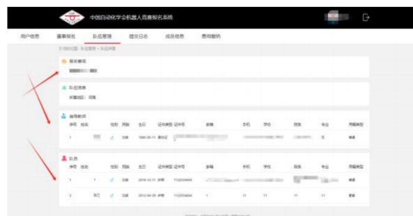
报名成员排列顺序查询 2