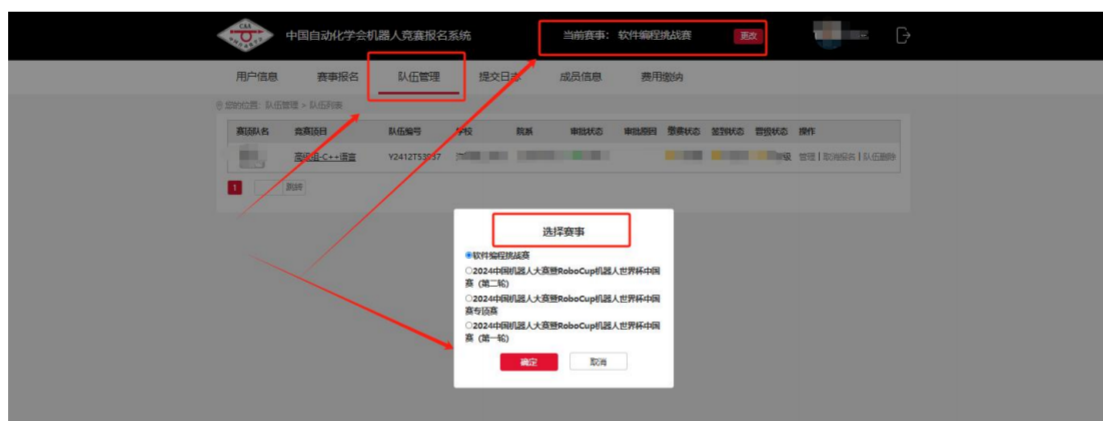
晋级赛队赛事切换

4、晋级审核通过的赛队报名者可以于2025年3月26日至3月30日登陆报名系统，选择“当前赛事”-“队伍管理”-“选择赛事”切换至“国赛”，即可查看晋级赛队情况。届时可对队伍成员进行调整，上传免责声明。组委会将同步进行报名审核；